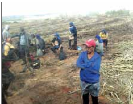
Figura 2. Trabalhadores no corte de cana-de-açúcar, Maringá, PR

Este trabalho foi realizado com 61 trabalhadores rurais em seu local de trabalho, durante o expediente (Figuras 2 e 3). A coleta foi realizada retirando-se material das bordas dos dedos e das unhas das mãos, previamente limpas com álcool 70%, com o auxílio de uma cureta odontológica e lâmina de bisturi. O material coletado foi colocado em placas de petri ou tubos de ensaio contendo salina, todos previamente esterilizados.