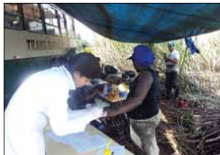
Figura 3. Procedimentos de coleta de amostras de unha de pele das mãos dos cortadores de cana