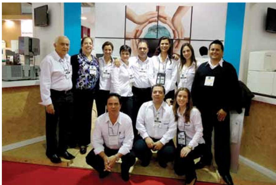
Equipe da Horiba Medical participa de Congresso em Curitiba

Por meio de todo este trabalho, a Horiba Medical consagra-se como provedora de soluções e aliada dos laboratórios e distribuidores. A empresa aposta no estreito rela-