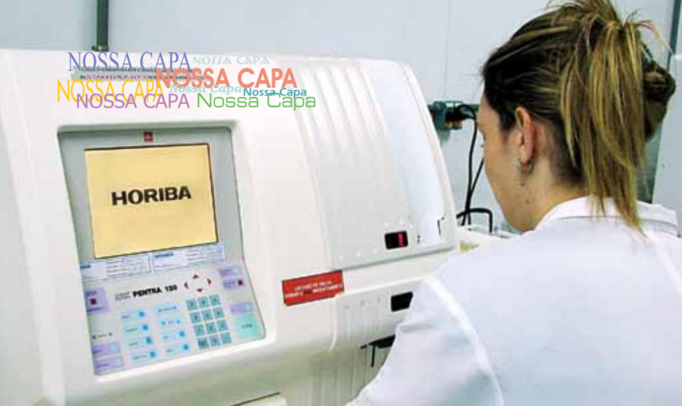
Pentra 120: solução da Horiba para grandes rotinas

cionamento com esses parceiros de negócios em busca de ferramentas que representem e traduzam características como desempenho, qualidade, inovação, tecnologia e competitividade de seus produtos.