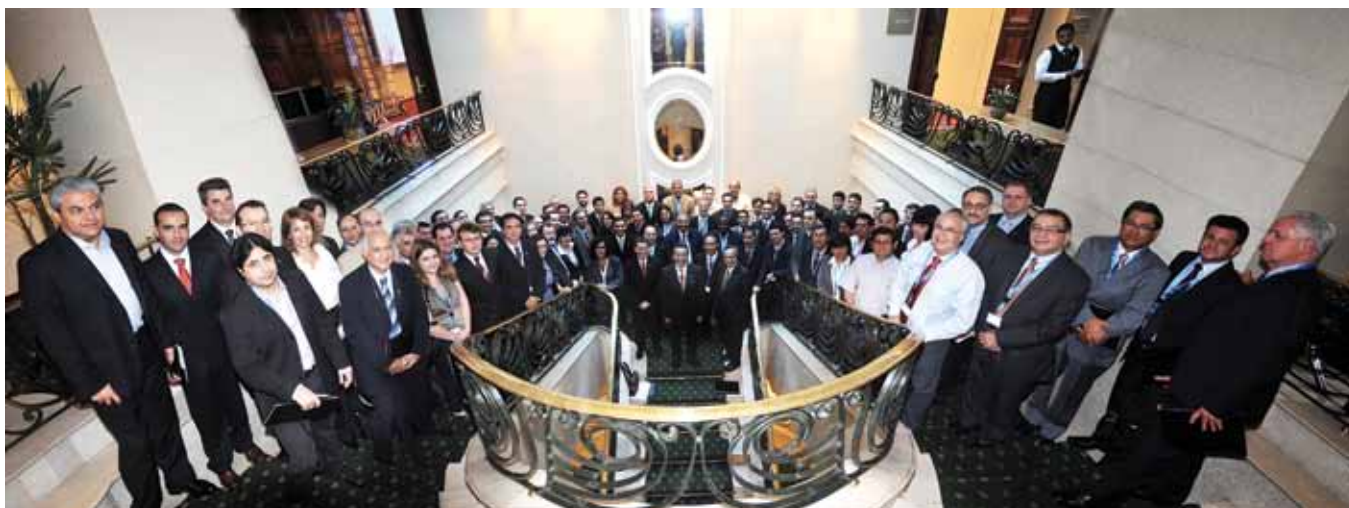
Encontro da equipe da América Latina e do Brasil, reforçando o conceito de One Company